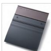
Ardoise céramique Bellus