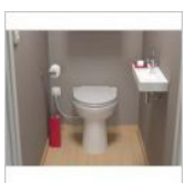
Sanicompact 43 Silence