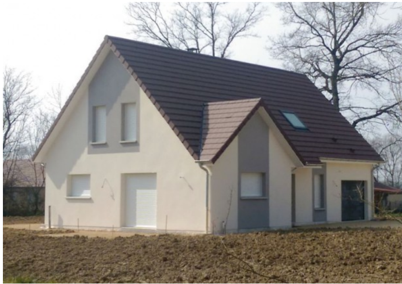
Maison Monnier - Effinergie + © Les Constructions de Tradition